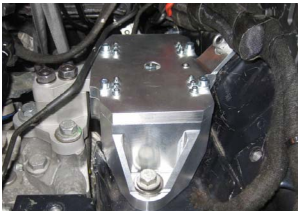
Komfortsteigerung durch Nachrüsten eines aktiven Motorlagers.